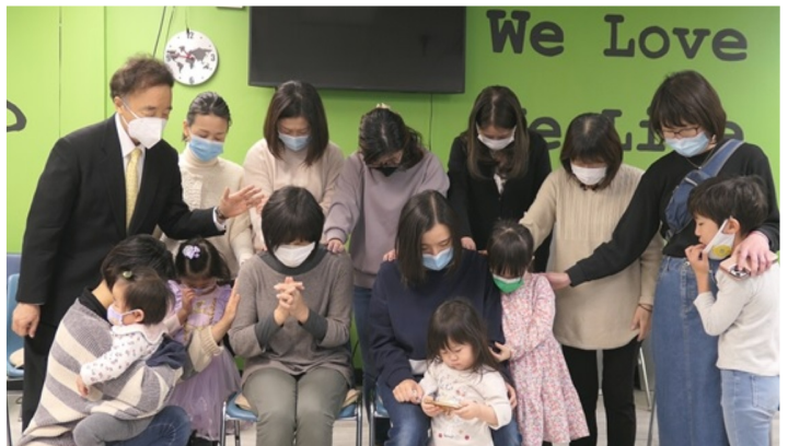
2人が帰国することになり「派遣の祈り」がささげられた(3/6)

3月に2人の教会員が帰国いたしました。3月6日(日)礼拝後、2人の派遣式を教会で行いました。Zoom参加の方も含めて一人一人感謝と励ましの言葉をお贈りし、送り出しました。2名のうち1名はNYめぐみ教会で受洗されたので、帰国後、通う教会を決めることとなります。受け入れてくださる教会の皆様、なにとぞよろしく願いいたします。また、比較的最近受洗された方を対象に、「受洗後の学び」を継続して行っています。