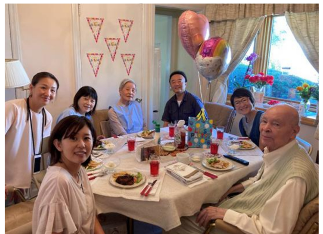
97歳になられた教会員の誕生日祝いランチの様子

昨年から今年にかけて日本に帰国された3名の姉妹が、NYめぐみ教会でゴスペルを体験して帰国したOBたちとともにゴスペル同窓会を持つという形で、フォローアップ伝道に携わっています。NYめぐみ教会のOBによる帰国者への伝道活動が続けられていることもおぼえていただければと思います。