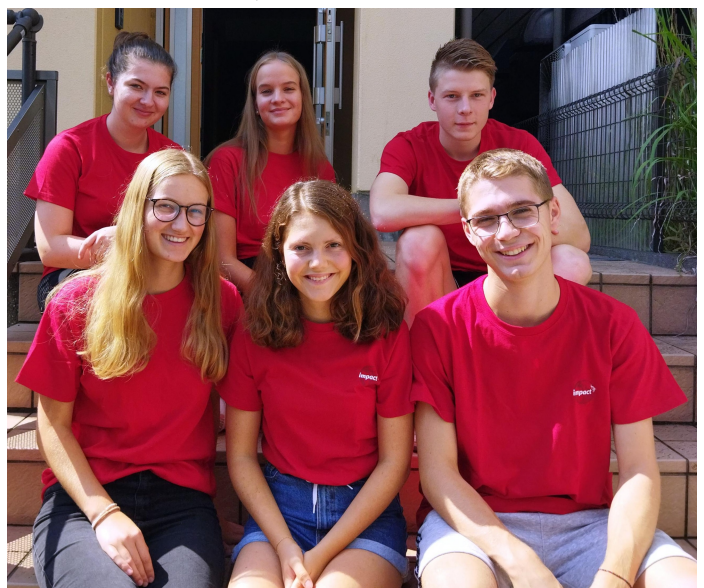
期待されるIMPACTチームのメンバー