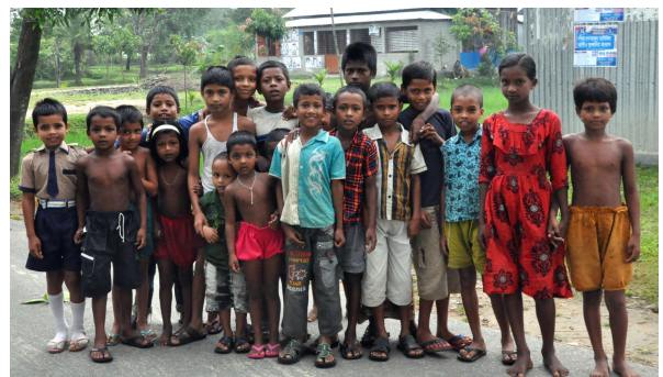
ジョイランクーラの病院近くの子供たち

9月16日の理事会でこの方針は承認されました。ということで、まだしばらく待ちの時間が続きます。みなさまのお祈りを感謝します。