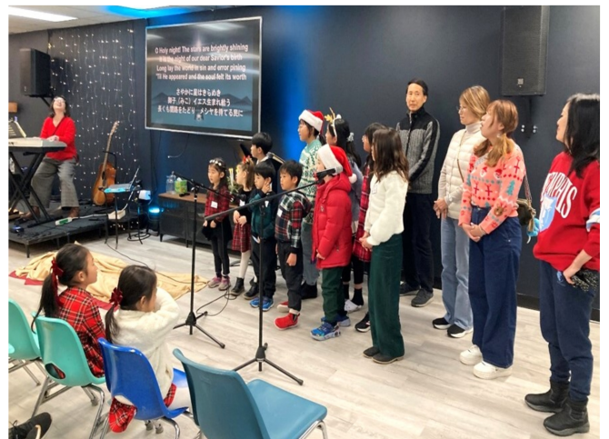
親子クリスマス会で賛美する子どもたち

昨年同様、クリスマスに一番近い主日に多くのご家族をお招きするため、12月22日(日)のウェルカム礼拝を「親子クリスマス会」という形で行いました。ゴスペルコンサートに出演した親子のメンバーには、コンサートでも歌った曲「Oh Holy Night」を歌ってもらいました。クリスマスのテーマから聖書の信頼性をお話しし、コンサート同様、ヨハネ3章16節から救いへの招きを行いました。礼拝の部の後は楽しいゲームの時間を持ち、子どもたちはとても楽しんでくれていました。語られた福音が老若男女すべての求道者の内でやがて実を結ぶことを願い祈っています。